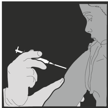
PARTE SUPERIOR DEL BRAZO