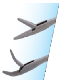
Pinzas de micro agarre